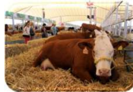
Ferias y exposiciones