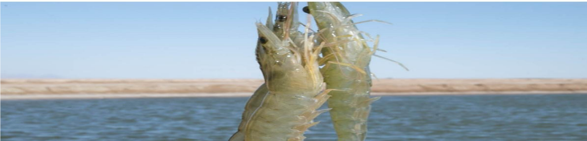
Imagen: Parallax, mayor de 900x300px. La imagen tiene que ser la referencia del trabajo que realizan los Comités de calidad.

Nota* evitar copiar y pegar contenido de otros sitios ya que arrastran los códigos predeterminados.