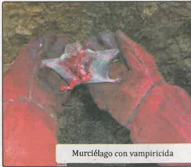
Murciélago con vampiricida