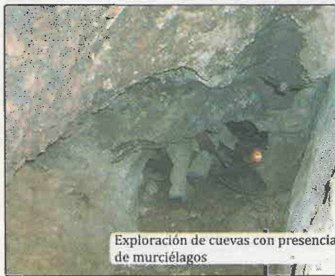
Exploración de cuevas con presencia de murciélagos