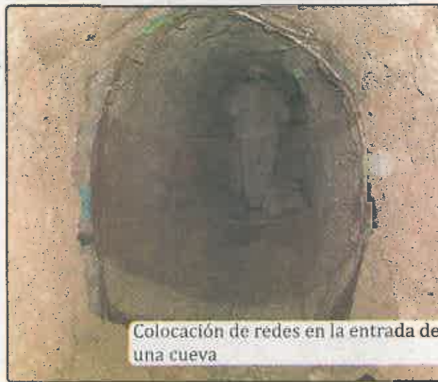
Colocación de redes en la entrada de una cueva