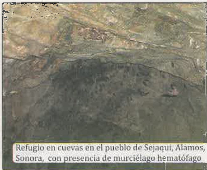
Refugio en cuevas en el pueblo de Sejaqui, Alamos, Sonora, con presencia de murciélago hematófago