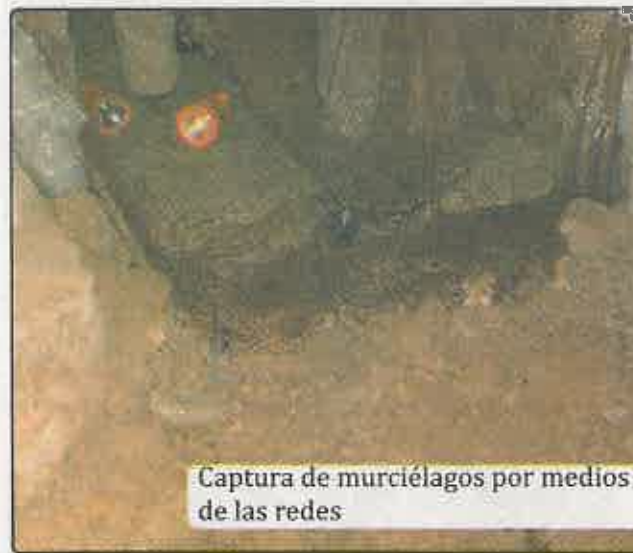
Captura de murciélagos por medios de las redes