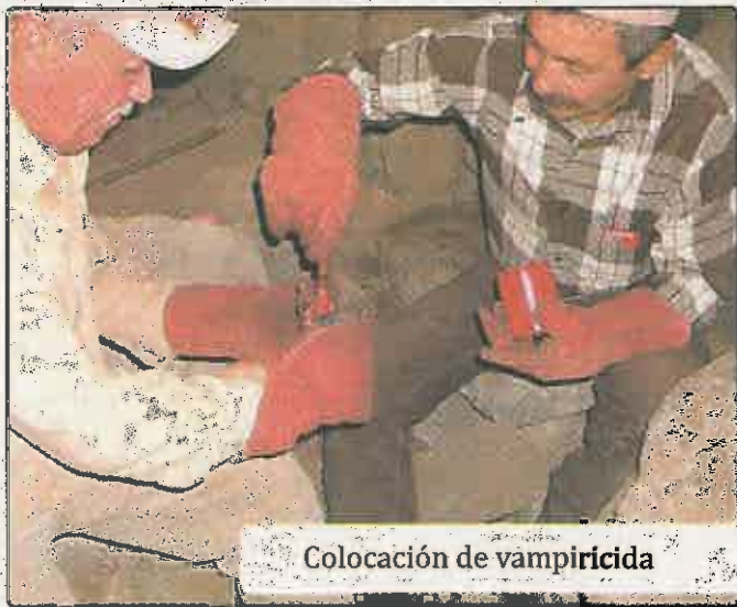
Colocación de vampiricida