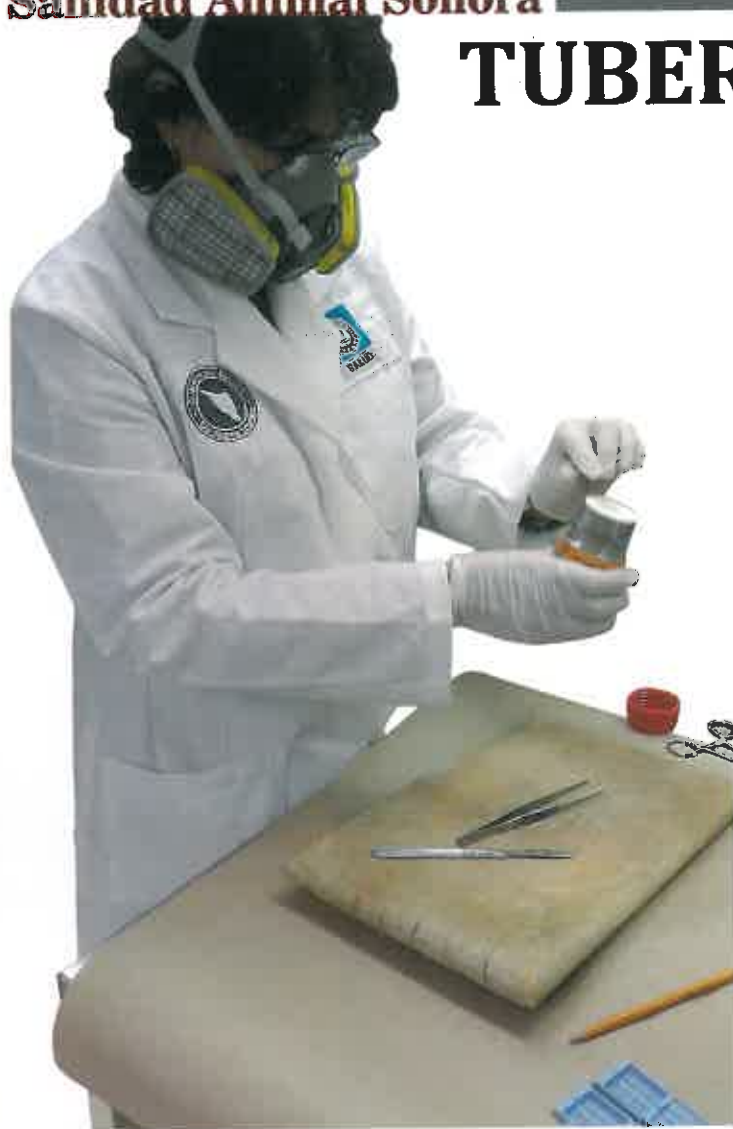
Identificación de lesiones histopatológicas en el laboratorio inicia la cuarentena precautoria