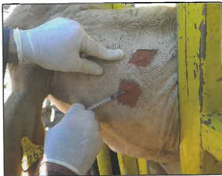
Un médico del Comité realizando una prueba cervical

L a Tuberculosis Bovina, así como la Tuberculosis Humana, ha existido desde hace muchos años y su forma de manifestarse generalmente es afectando a los pulmones, de donde las bacterias salen a través de las expectoraciones o con la tos que es característica, con lo cual infectan a otros animales o al agua donde otros animales también beben.